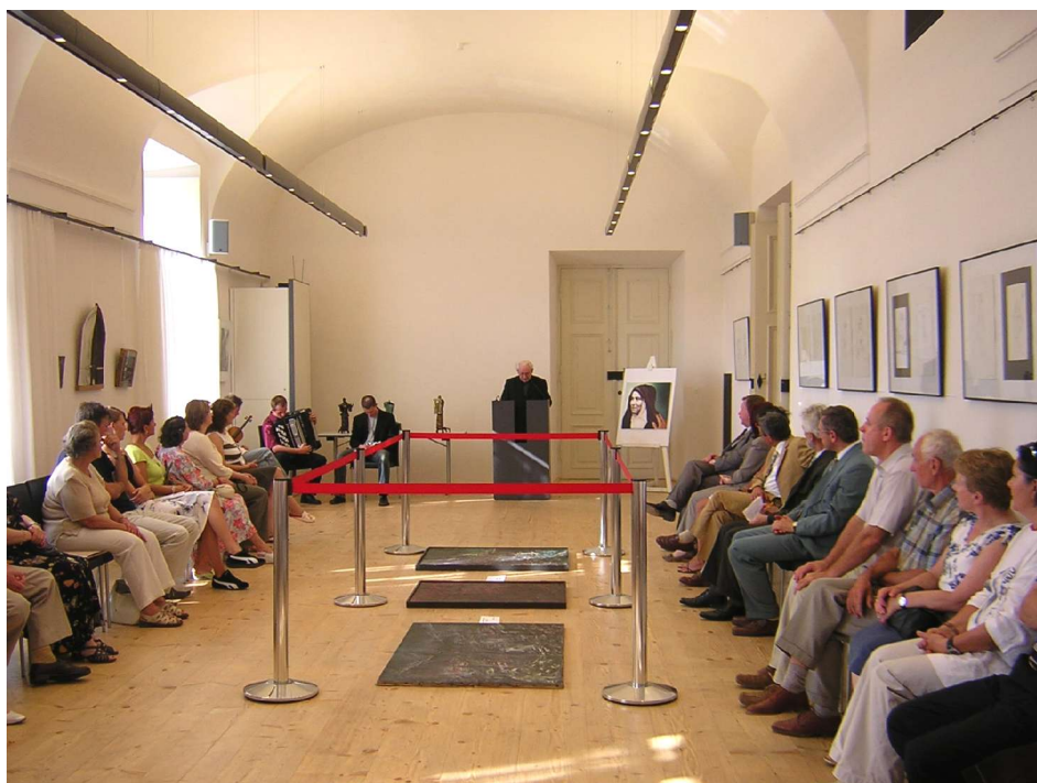
Uroczyste otwarcie wystawy

„Hommage a` Edith Stein”- wystawa malarska od 4 – 25 września 2005 r. w zamku barokowym „Residenzschloss” w Ludwigsburgu.