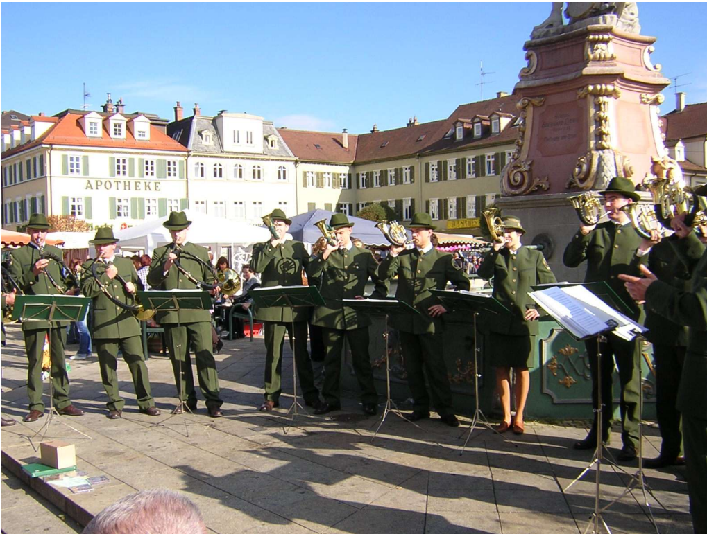
Koncert zespołu trębaczy ze szkoły leśnej z Goraja (woj. wielkopolskie) na Marktplatzu w Ludwigsburgu w dniu 22.10.2005