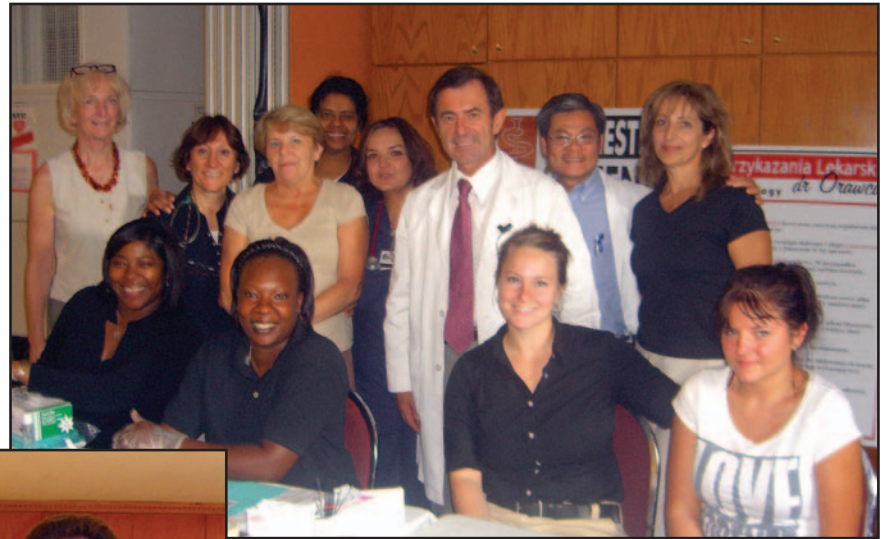
Zespół biorący udział w akcji bezpłatnych badań w Chicago. Kościół św. Konstancji. 6 października 2007

Jak każdego roku, było bardzo duże zainteresowanie – z badań oraz konsultacji skorzystało przeszło 130 osób. Akcja została przeprowadzona bardzo sprawnie. Każdy z pacjentów po wypełnieniu aplikacji oraz ankiety miał mierzone ciśnienie, a następnie pobraną próbkę krwi do analizy. Wszystkie badane osoby otrzymały wydruk komputerowy z kompletnymi wynikami całkowitego cholesterolu, frakcji LDL („zły” cholesterol), HDL („dobry” cholesterol), trójglicerydów, poziomu cukru we krwi, ciśnienia tętniczego oraz wskaźnika otyłości, a także ryzyka wystąpienia choroby wieńcowej serca. Zostały przygotowane stoiska firm farmaceutycznych, były dostępne broszury informujące o sposobach zwalczania głównych czynników ryzyka miażdżycy oraz zalecenia dietetyczne w języku polskim. Należy podkreślić, że wiele osób miało wykonane badania po raz pierwszy w życiu.