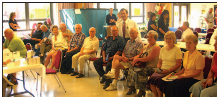
Grupa uczestników badań na cholesterol w kościele św. Konstancji.

Należy podkreślić, że pomimo ogromnego postępu w kardiologii, a także pewnego spadku występowania chorób sercowo-naczyniowych oraz udarów mózgu, choroby te nadal są najczęstszymi przyczynami zgonów nie tylko w Stanach Zjednoczonych, ale również na całym świecie. Choroby układu krążenia są przyczyną śmierci 17,5 miliona osób każdego roku. Ciśnienie tętnicze, poziom cholesterolu, lipi-