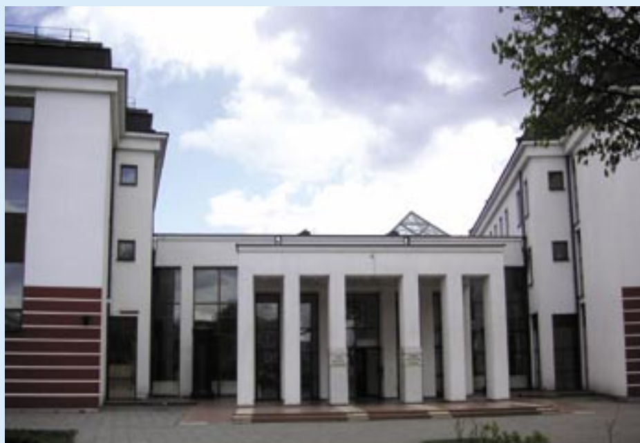
Dom Kultury Polskiej.