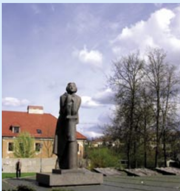
Pomnik Adama Mickiewicza.

ale i logistyczną. Te skromne napisy przy wejściu trzeba zamienić na duże neony (jeśli trzeba nawet w oparciu o prawo unijne) a restauracja musi być lokalem, do którego będzie kolejka na miejsce przynajmniej na miesiąc wcześniej. Bywam w Polsce kilkanaście razy w roku. Ludzie, tam są takie restauracje, że się w głowie nie mieści! Czy nie da się jednej takiej przenieść nad Wiliję! Polonia litewska skłócona jak wszystkie - to temat, do którego musimy wrócić w następnych artykułach. To ważna i potrzebna Polonia. Potrzebna Litwie i Polsce - potrzebna Europie. Musi być znowu wzorem współistnienia różnych kultur i religii, musi pomóc litewskim politykom zrozumieć polityczny alfabet!