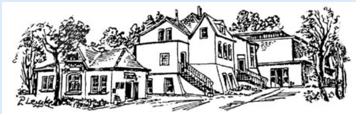
Rycina Domu Polskiego w Recklinghausen.

„Zgoda” zarejestrowana została w 1952 r. w Hamburgu. Powstała na gruncie 5-ciu Prawd Polaków, uchwalonych na historycznym Kongresie w Berlinie w 1938 r w przeddzień wybuchu II wojny światowej. Oto prawdy, które były drogowskazem dla każdego Polaka na długie lata: 1. Jesteśmy Polakami, 2. Wiara ojców naszych jest wiarą naszych dzieci, 3. Polak Polakowi służy, 4. Co dzień Polak narodowi służy, 5. Polska jest Matką naszą - nie wolno mówić o Matce źle.