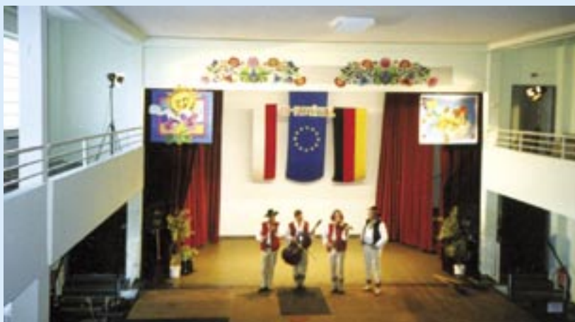
Fragment jednego z koncertów w Domu Polskim.